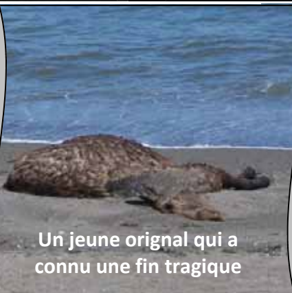
Un jeune original qui a connu une fin tragique